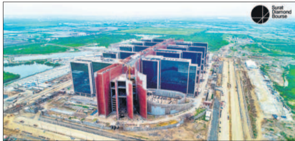
The Surat Diamond Bourse

MUMBAI: The newly built Surat Diamond Bourse (SDB), is a stunning 6.7 million square feet space, but for now it is an empty empire. The Kathiawadi diamond merchants may have taken over large parts of the trade over the years, but Mumbai's Palanpuri diamantaires are hanging on to not just their business but also the city.