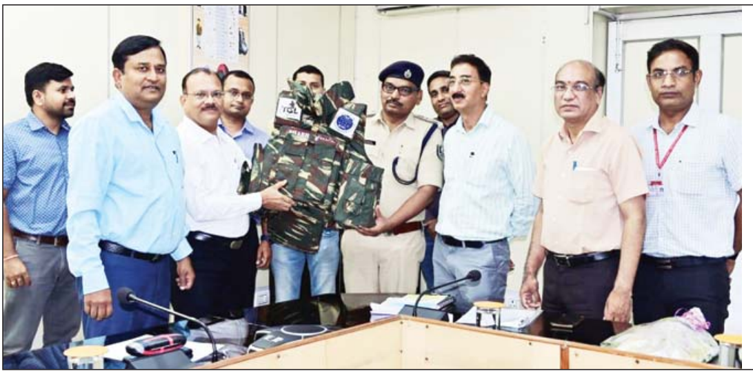
ओईएफ में बिहार पुलिस को बुलेट प्रूफ जैकेट सौंपते अधिकारी।

केरल की एसओजी के लिए भी तैयार हो रही जैकेटें